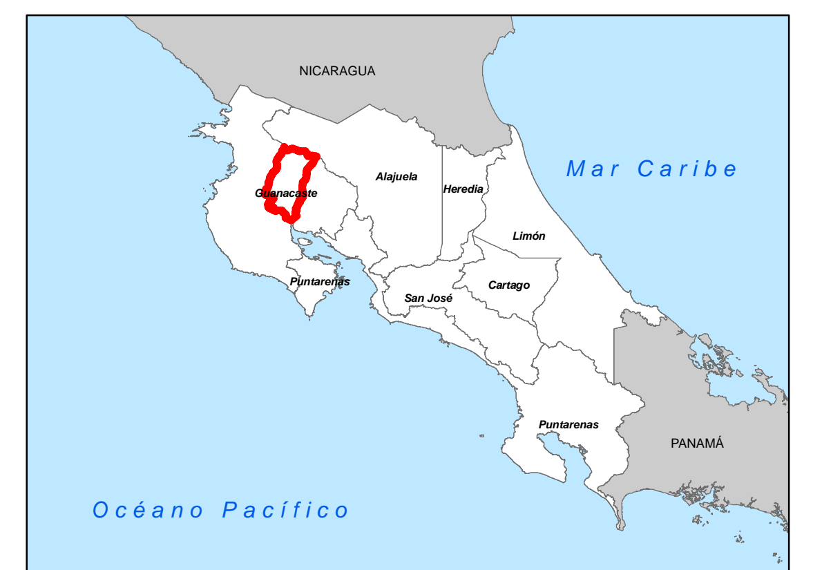
MATRIZ DE VALORES DE TERRENOS AGROPECUARIOS PROVINCIA 5 GUANACASTE CANTÓN 04 BAGACES