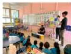
Escuela General Tomás Guardia