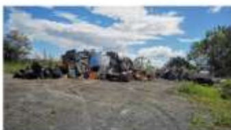
30 No tradicionales