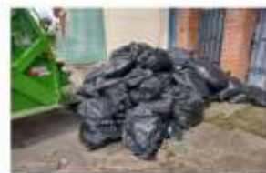
Denuncia Colegio de Bagaces