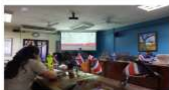
Comisión Plan Regulador