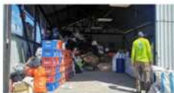
Centro de Transferencia Valorizables