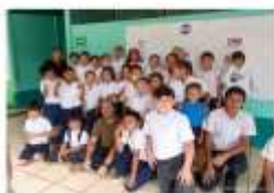
Escuela Adolfo Berger