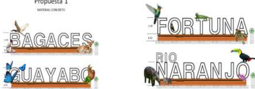
15 Propuesta 1 16 MATERIAL CONCRETO

21 Tenemos las letras en cemento, si se hizo un sondeo al igual como lo indicó Raymond 22 con proveedores de este material, sí encontramos para tener el respaldo, ahí tenemos las 23 cuatro propuestas que son las mismas que habíamos visto anteriormente.